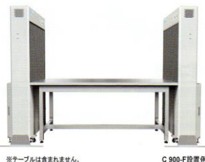
※キールは含まれません。